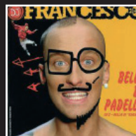
«La canzone del capitano» – 2003 DJ FRANCESCO