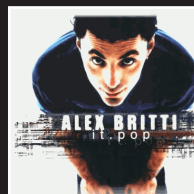
«Solo una volta (o tutta la vita)» | 1998 ALEX BRITTI