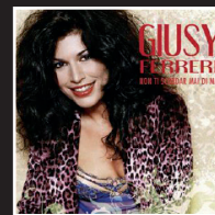
«Non ti scordar mai di me» | 2008 GIUSY FERRERI