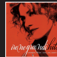
«Bruci la città» | 2007 IRENE GRANDI