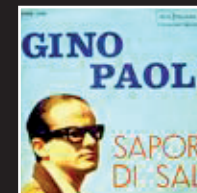
«Sapore di sale» | 1963 GINO PAOLI

4.54: a partire da questo momento fino all'esercizio 4.68 per le attività in classe si consiglia di seguire due percorsi paralleli: in alcune ore di lezione gli studenti possono dedicarsi al progetto sui tormentoni, in altre possono esercitarsi sul passato prossimo (4.55-4.68). L'attività può consistere in un laboratorio di ripasso (gli studenti scelgono l'ordine delle attività, autovalutandosi con degli smile) o in classici esercizi assegnati dall'insegnante. La combinazione di «progetto tormentoni» e grammatica alleggerisce la fase di consolidamento.