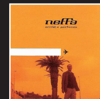
«La mia signorina» | 2001 NEFFA