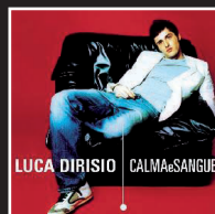
«Calma e sangue freddo» | 2004 LUCA DIRISIO