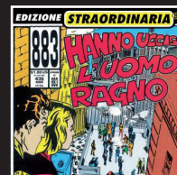
«Hanno ucciso l'uomo ragno» | 1992 883