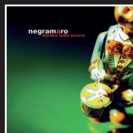
«Estate» | 2005 NEGRAMARO