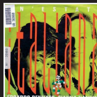
«Un'estate italiana» | 1990 GIANNA NANNINI E EDOARDO BENNATO