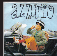
«Azzurro» | 1968 ADRIANO CELENTANO