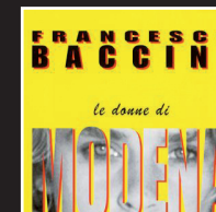
«Sotto questo sole» | 1990 FRANCESCO BACCINI E LADRI DI BICICLETTE