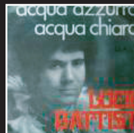
«Acqua azzurra, acqua chiara» | 1969 LUCIO BATTISTI