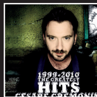
«Mondo» | 2010 CESARE CREMONINI

2013, 2014, 2015, 2016, 2017, 2018, ...?