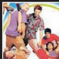
«50 Special» | 1999 LUNAPOP