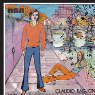
«Piccolo grande amore» | 1972 CLAUDIO BAGLIONI